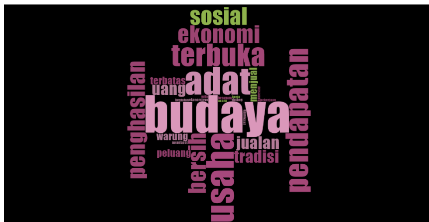
Gambar 4. Word Frequency Query terkait Dampak Partisipasi Masyarakat

Kata-kata seperti ‘usaha’, ‘pendapatan’, dan ‘ekonomi’ menunjukkan bahwa keterlibatan masyarakat juga memiliki dimensi ekonomi, di mana mereka memperoleh manfaat finansial dari partisipasi dalam kegiatan pariwisata. Selain itu, kata ‘kadang’ dan ‘terlibat’ menandakan bahwa partisipasi masyarakat dapat bersifat fleksibel, tidak selalu konsisten untuk setiap individu, tetapi secara kolektif mereka tetap menjalankan peran penting dalam keberlangsungan dan keberhasilan pengelolaan pariwisata berbasis komunitas.