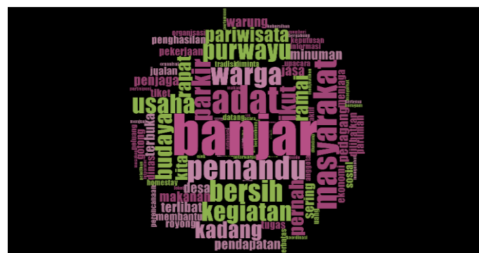
Gambar 3. Word Frequency Query terkait Bentuk Partisipasi Masyarakat

Analisis ini bertujuan untuk mengidentifikasi kata-kata yang paling sering muncul, sehingga memberikan gambaran awal mengenai tema dan fokus utama dalam data. Chart berikut akan menyajikan kata-kata yang paling dominan, beserta jumlah kemunculannya, sehingga memudahkan dalam interpretasi dan penelusuran lebih lanjut terhadap konteks dan makna yang terkandung, seperti yang ditampilkan oleh gambar di bawah ini.