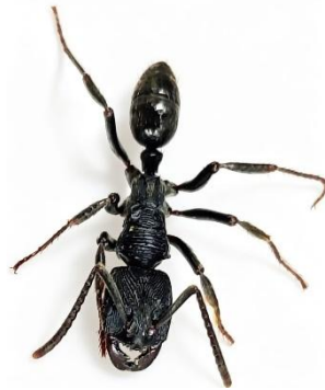
Gambar 2. Semut Myopopone castanea

Telur semut Myopopone castanea berwarna putih dan berbentuk lonjong. Jumlah telur yang dihasilkan oleh seekor ratu bisa mencapai 396 butir dalam satu kali peletakan. Perkembangan larva Myopopone castanea terdiri dari lima instar. Larva berbentuk vermiform (seperti cacing) dan berwarna putih. Bentuk tubuhnya silindris memanjang, tanpa lampiran tubuh, tanpa mata, dan tanpa kaki, sehingga larva bergerak menggunakan gerakan tubuh peristaltik hidroskeleton. Panjang waktu perkembangan tiap instar berbeda. Perkembangan dari instar pertama ke kedua sangat cepat, rata-rata 2,3 hari. Durasi dari instar kedua ke ketiga sekitar 4,9 hari, ketiga ke keempat sekitar 7,3 hari, keempat ke kelima sekitar 11 hari, dan instar kelima berlangsung sekitar 16,4 hari (Widihastuty, et al., 2020).