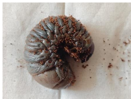
Gambar 3. Pembusukan Larva

Berdasarkan hasil penelitian yang dilakukan (Widihastuty 2020) di laboratorium Semut Myopopone castanea menyerang mangsanya dalam keadaan masih hidup dengan cara menggigit dan menyengatnya hingga mati lalu memakan cairan hemolimfnya. Gejala awal yang ditunjukkan pada larva Oryctes rhinoceros adalah pada kutikula larva yang berubah menjadi warna kecokelatan dan menghitam secara bertahap. Tubuh larva akan menghitam dan rusak tercabik-cabik akibat dari gigitan dan sengatan semut Myopopone castanea sehingga hanya tersisa bagian kutikulanya saja (Widihastuty, 2020).